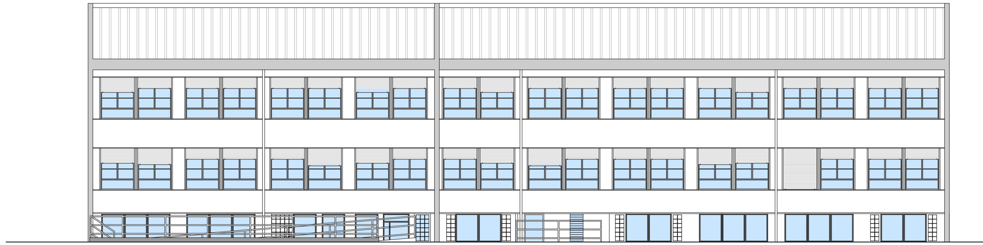
PROSPETTO A edificio scolastico esistente - stato di fatto