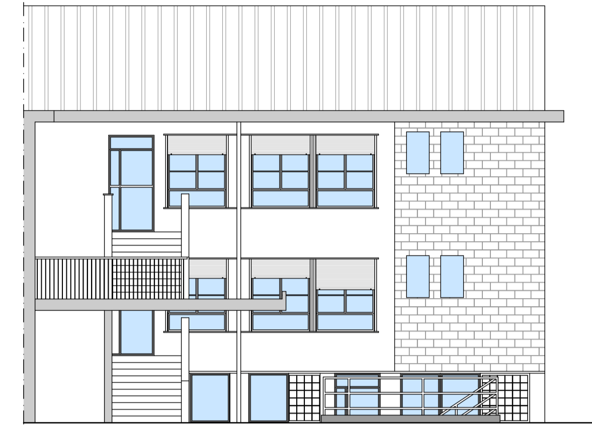
PROSPETTO B edificio scolastico esistente - stato di fatto