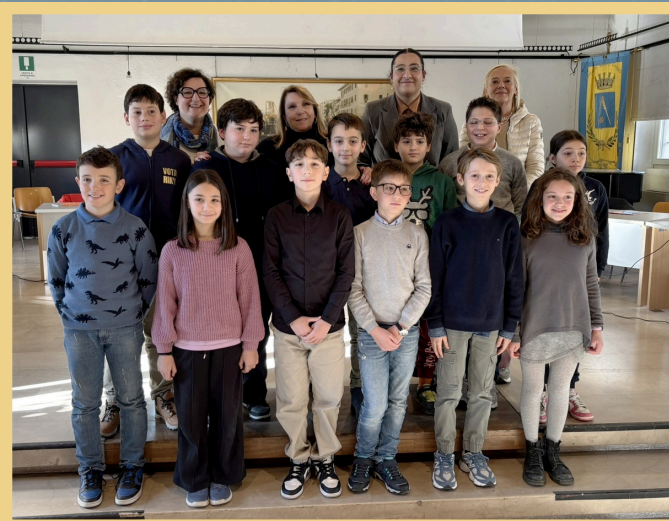
Consiglio Comunale Ragazzi, seduta del 29.11.2025