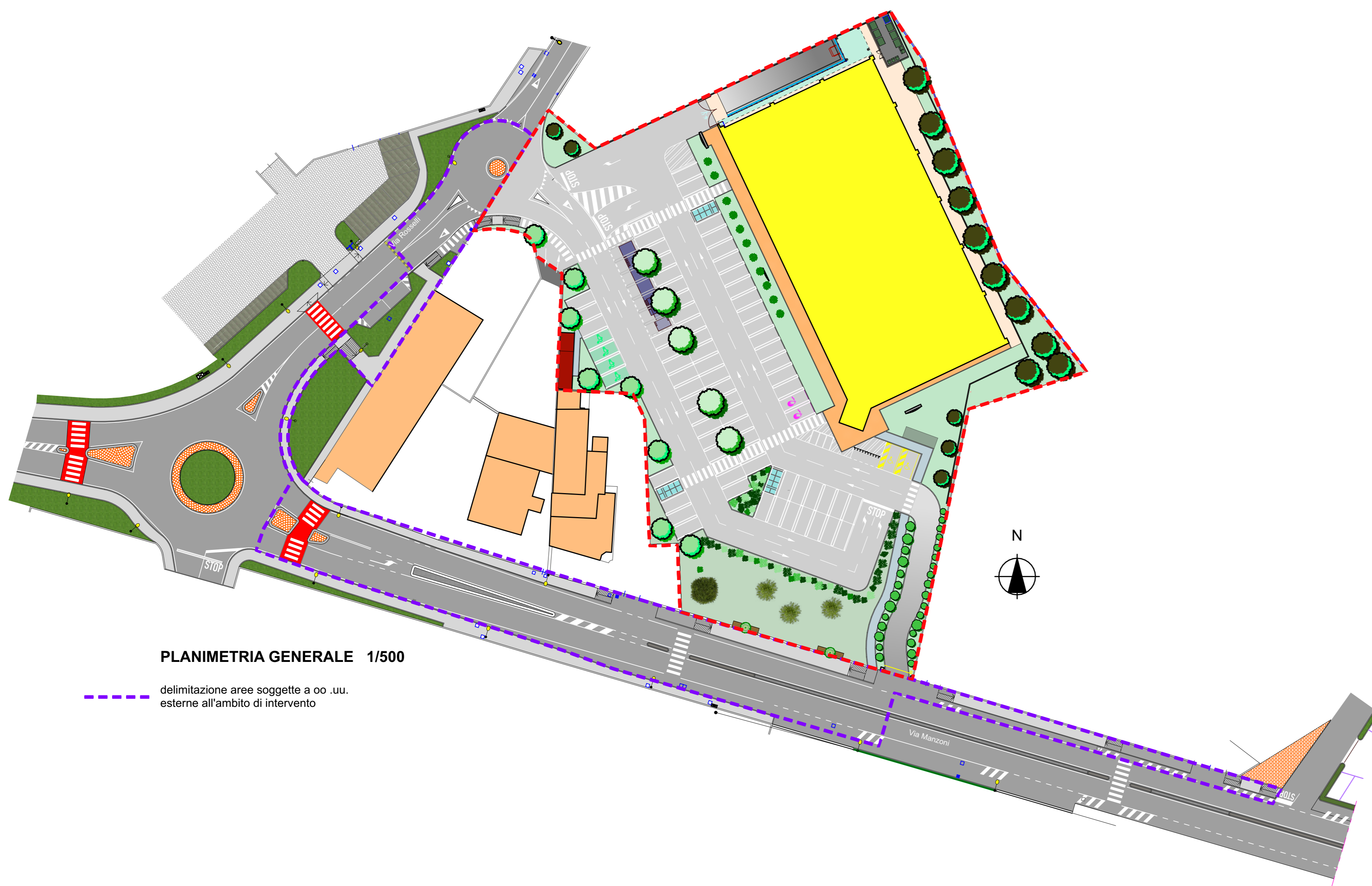
PLANIMETRIA GENERALE 1/500

--- rappresentazione ambito di intervento