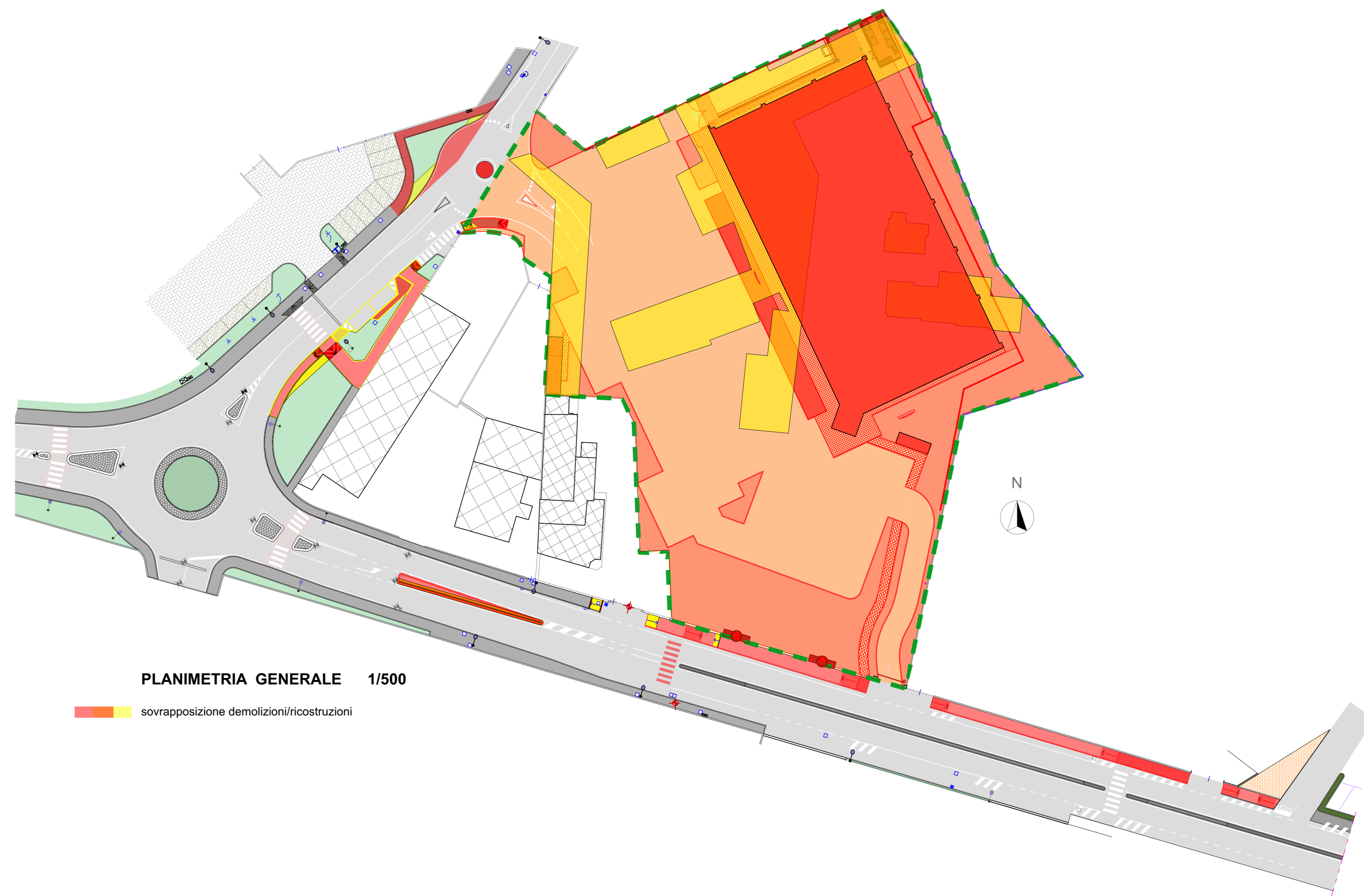
PLANIMETRIA GENERALE 1/500

sovrapposizione demolizioni/ricostruzioni