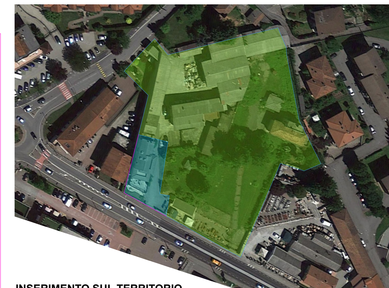
INSERIMENTO SUL TERRITORIO nello stato di fatto

ambito di intervento ■ lotto interessato art. 10 NTA ■