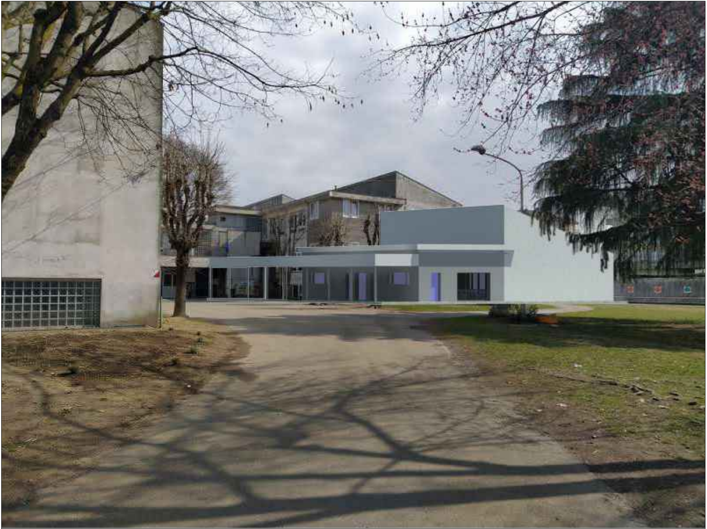
VISTA DAL VIALE DI INGRESSO