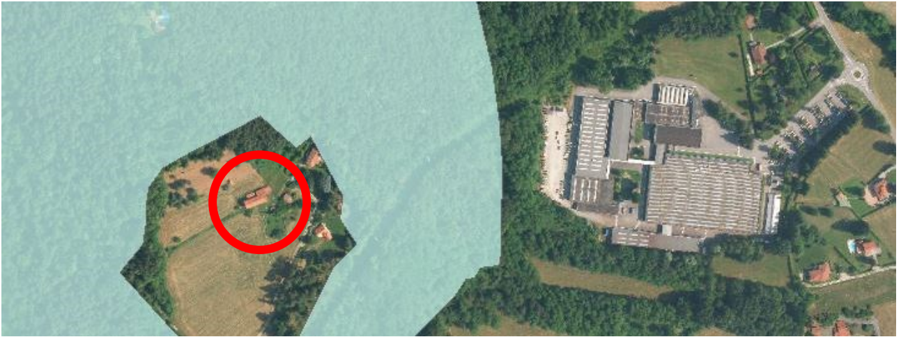
PGT vincolo di tutela idrogeologica R.D. 3267/1923