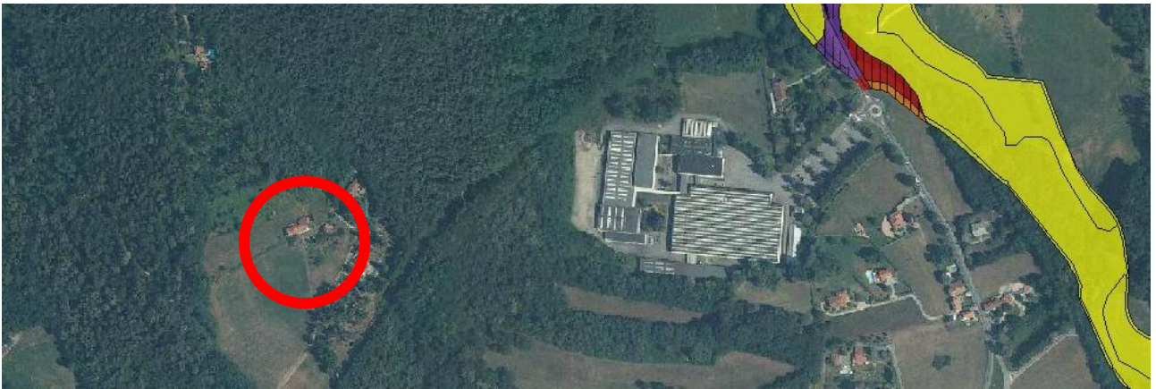
PGRA mappa del rischio