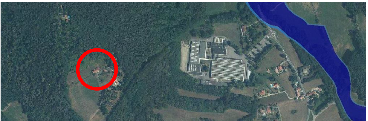
PGRA mappa della pericolosità