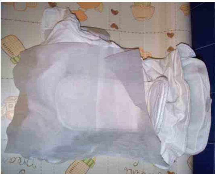
La composizione a strati: mutandina esterna impermeabile, pannolino e inserto lavabili, velo raccogli feci.